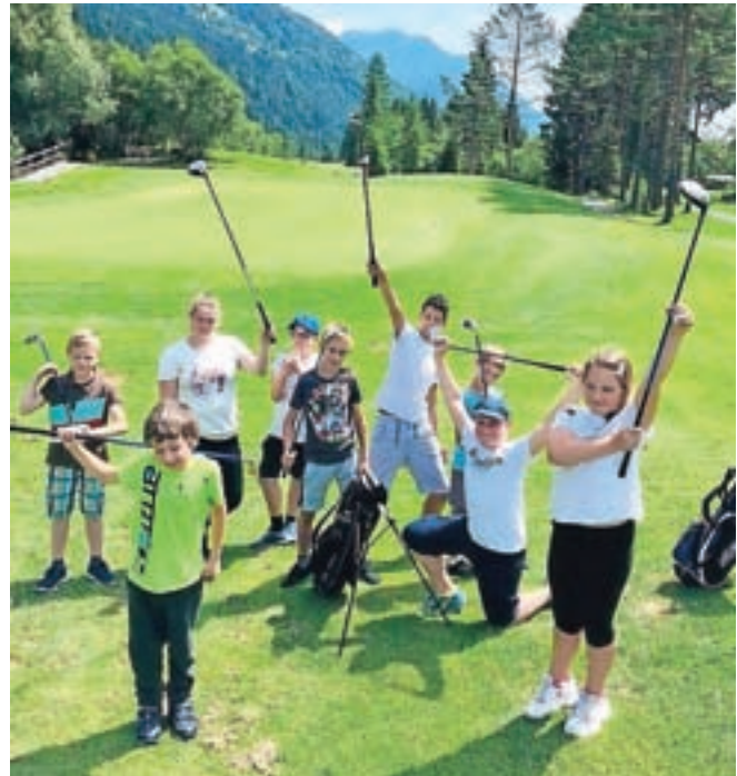
Mladi so spoznali osnovne udarce ...