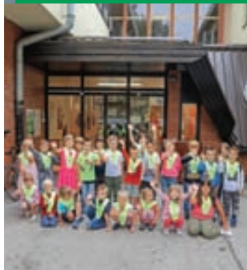
Na naslovnici: Prvošolci v Mojstrani